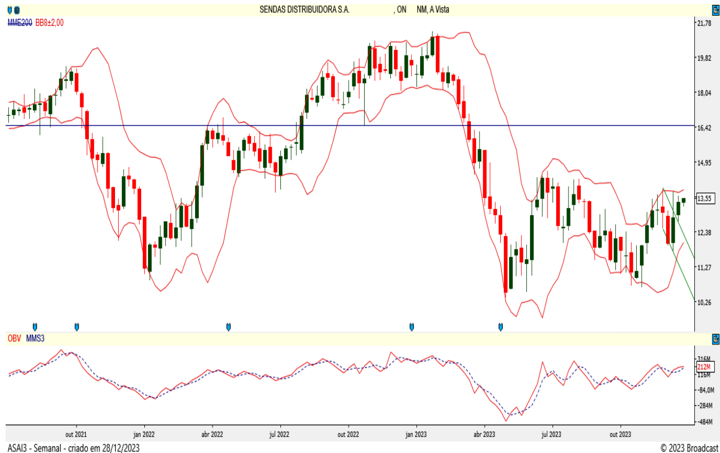
ASAI3 - Semanal - criado em 28/12/2023

A ação do Assaí tem suporte nos R$ 12,35 e deve ultrapassar a resistência dos R$ 13,91 para alcançar seu alvo nos R$ 16,49. Suas bandas de Bollinger estão apontadas para cima e o papel apresenta saldo de volume positivo.