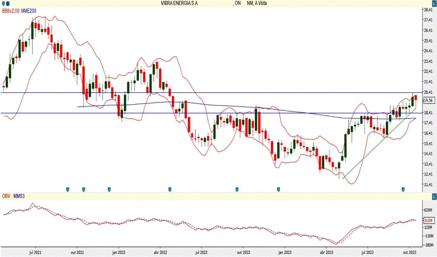
VBRR3 - Semanal - criado em 20/10/2023

A ação da Vibra Energia engatou um movimento de recuperação e, com suporte nos R$ 18,42, conseguiu cruzar sua banda de Bollinger superior. Agora, deve ultrapassar a resistência dos R$ 20,35 para alcançar os R$ 23,27. Atualmente, trabalha acima de sua média móvel exponencial de 200 períodos com bom saldo de volume.