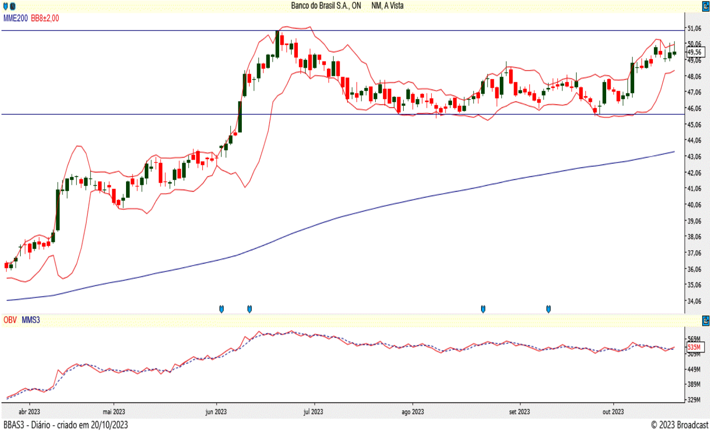
BBAS3 - Diário - criado em 20/10/2023

Em tendência de alta, a ação do Banco do Brasil tem suporte nos R$ 45,71 e deve buscar a resistência dos R$ 50,90. Caso ultrapasse esse ponto, pode ir até os R$ 52,81. Suas bandas de Bollinger estão paralelas e fechadas, sendo que o papel trabalha acima de sua média móvel exponencial de 200 períodos. Também seu saldo de volume está positivo.