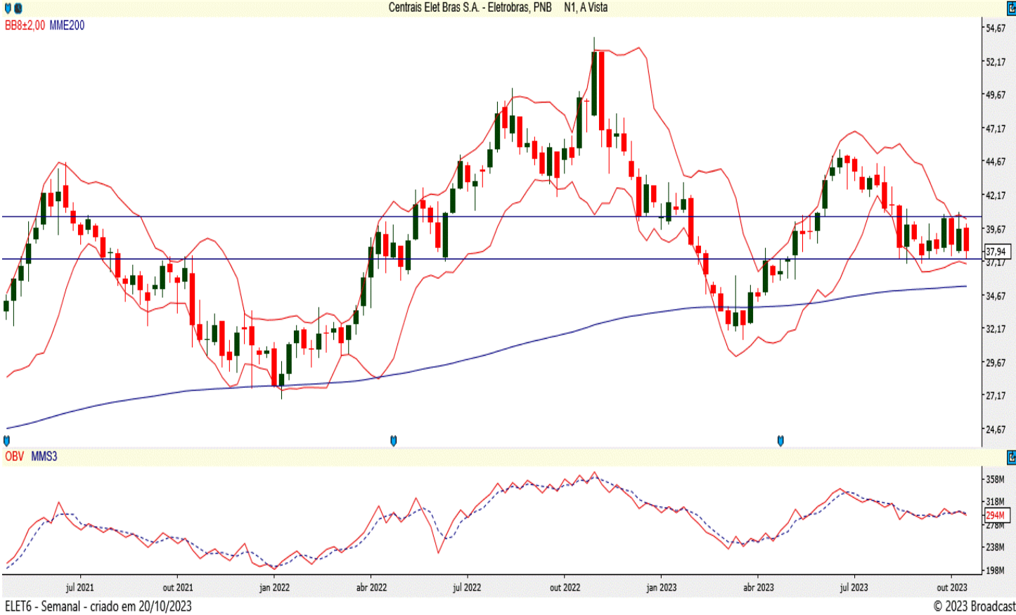
ELET6 - Semanal - criado em 20/10/2023

A ação da Eletrobras está em tendência de alta e, com suporte nos R$ 37,44, deve ultrapassar a resistência dos R$ 40,35 para continuar sua trajetória. Suas bandas de Bollinger estão paralelas e estreitas, sendo que o papel trabalha acima de sua média móvel exponencial de 200 períodos. Além disso, apresenta um bom saldo de volume.