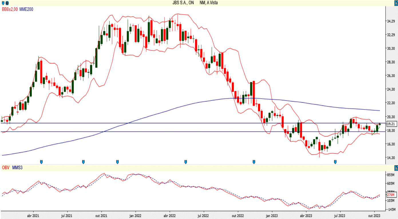
JBSS3 - Semanal - criado em 20/10/2023

Depois de sinalizar ter encontrado fundo nos R$ 15,28, a ação da JBS deve buscar o último topo nos R$ 19,88 e posteriormente sua média móvel exponencial de 200 períodos nos R$ 21,19. Para isso, testará novamente sua banda de Bollinger superior nos R$ 19,36 e depois precisa romper a resistência dos R$ 19,40. Como suporte, ficam os R$ 18,05, sendo que atualmente o papel tem bom saldo de volume.