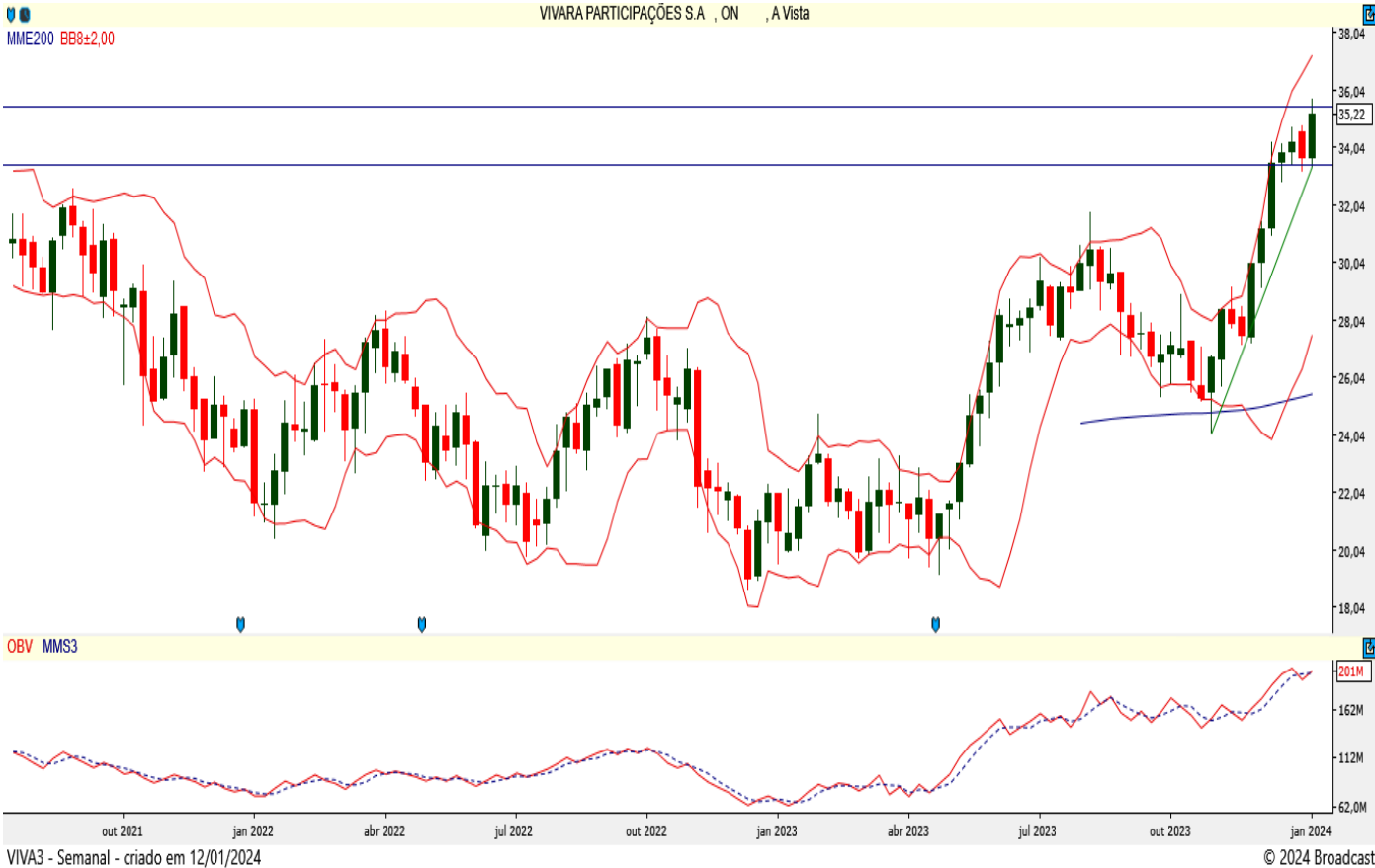
VIVA3 - Semanal - criado em 12/01/2024

A ação da Vivara tem suporte nos R$ 33,49 e deve ultrapassar a resistência dos R$ 35,76 para alcançar os R$ 37,28, o que seria um recorde para o papel. Suas bandas de Bollinger estão apontadas para cima e o ativo trabalha acima de sua média móvel exponencial de 200 períodos atualmente. Também conta com bom saldo de volume.