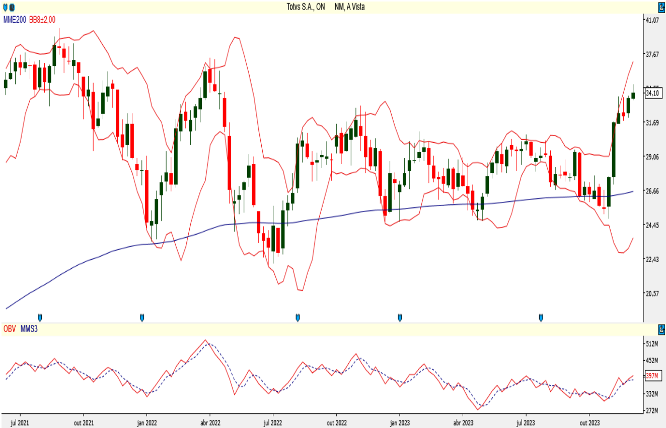
TOTS3 - Semanal - criado em 08/12/2023

A ação da Totvs tem suporte nos R$ 31,82 e deve romper a resistência dos R$ 36,20 para buscar os R$ 38,37. Suas bandas de Bollinger estão apontadas para cima e o papel trabalha acima de sua média móvel exponencial de 200 períodos atualmente. Além disso, apresenta saldo de volume positivo.