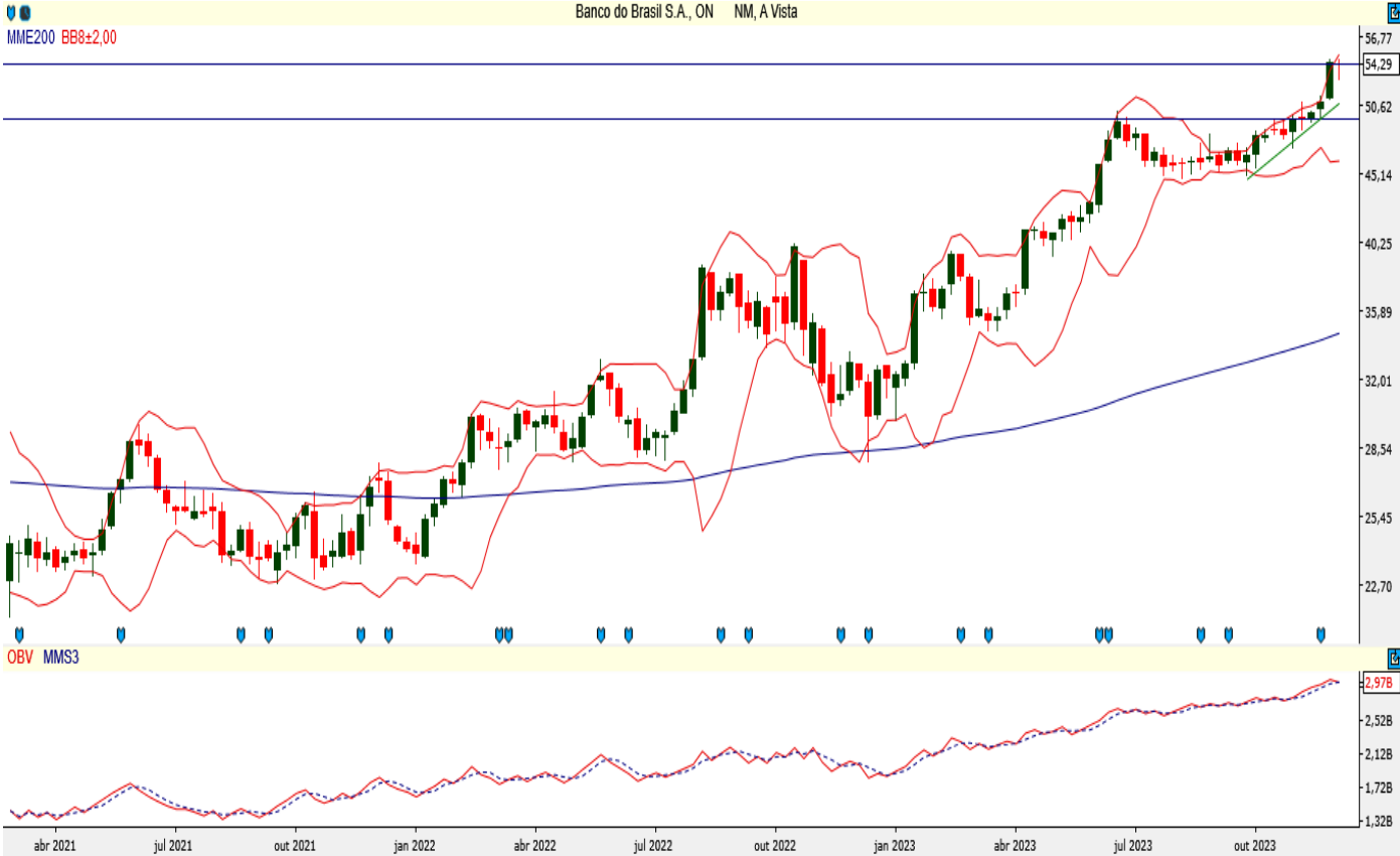
BBAS3 - Semanal - criado em 08/12/2023

Em tendência de alta, a ação do Banco do Brasil tem suporte nos R$ 49,62 e deve romper a resistência da sua banda de Bollinger superior nos R$ 55,17 para renovar máxima histórica. Atualmente, trabalha acima de sua média móvel exponencial de 200 períodos com bom saldo de volume.